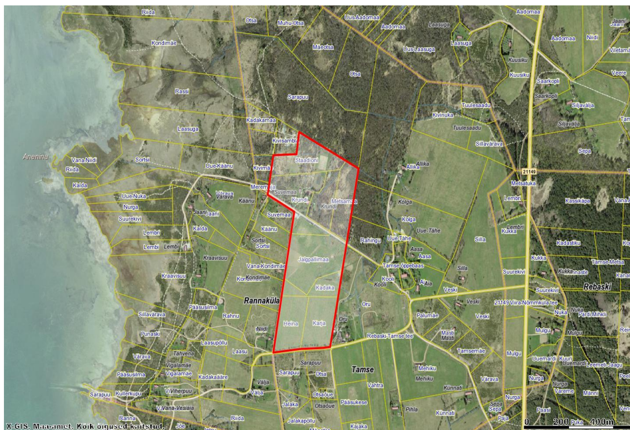
Joonis 1. Planeeringuala asendiskeem (Alus: Maa-ameti X-Gis kaardiserver, 25.04.2022)

Planeeringuala asub Saare maakonnas Muhu valla Tamse küla läänepoolses osas. Planeeringualasse kuuluvad Krundi (47801:002:0426, ärimaa), Staadioni (47801:002:0403, ärimaa), Viktorimaa (47801:002:0427, elamumaa), Metsamaa (47801:002:0429, maatulundusmaa), Jalgpallimaa (47801:001:0700, ärimaa), Kadaka (47801:001:0959, maatulundusmaa), Heina (47801:001:0961,